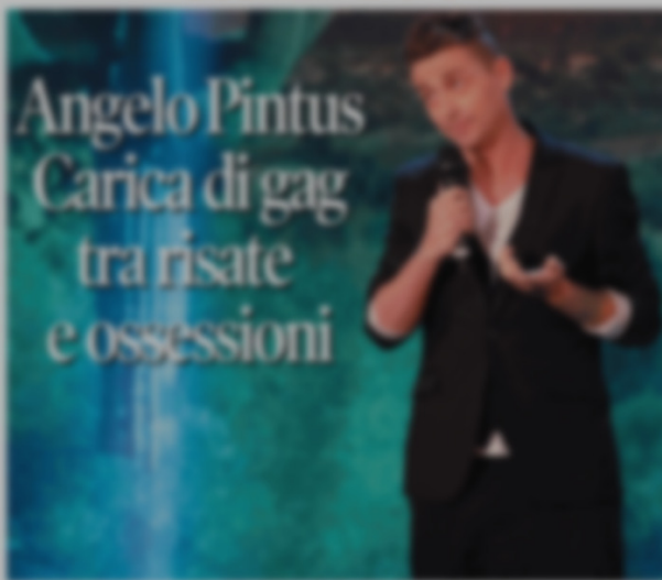
Il comico nel secondo appuntamento con «Nabucco»